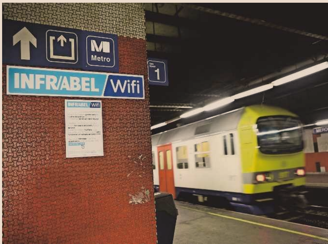
Mede door het datalek bij de NMBS slikte de privacycommissie 636 dossiers meer dan in 2012.